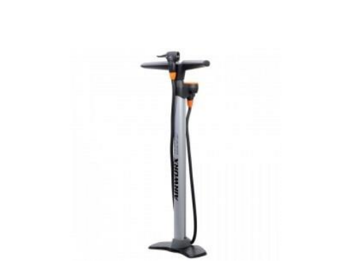
POMPE MODÈLE SKS AIRWORKS CONTROL

Option TH : Assistance au pédalage ou tout électrique avec accélérateur à la poignée, réservée aux voies privées avec supplément