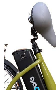
TIGE DE SELLE BASCULANTE