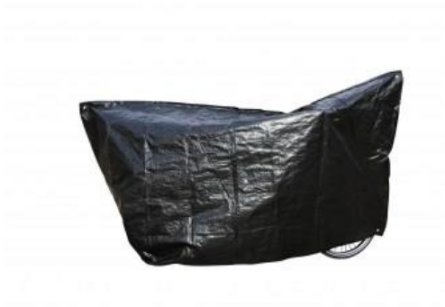
HOUSSE MODÈLE VK DUO