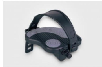
PAIRE DE PÉDALES À SANGLE MODÈLE FP