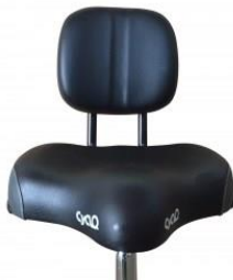
SELLE AVEC DOSSIER MODÈLE CYCLO2 RELAX