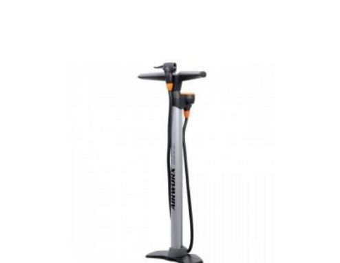
POMPE MODÈLE SKS AIRWORKS CONTROL