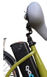
TIGE DE SELLE BASCULANTE