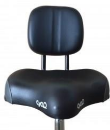
SELLE AVEC DOSSIER MODÈLE CYCLO2 RELAX