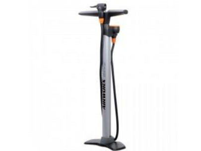
POMPE MODÈLE SKS AIRWORKS CONTROL