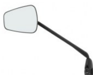
RÉTROVISEUR ZÉFAL ESPION Z56